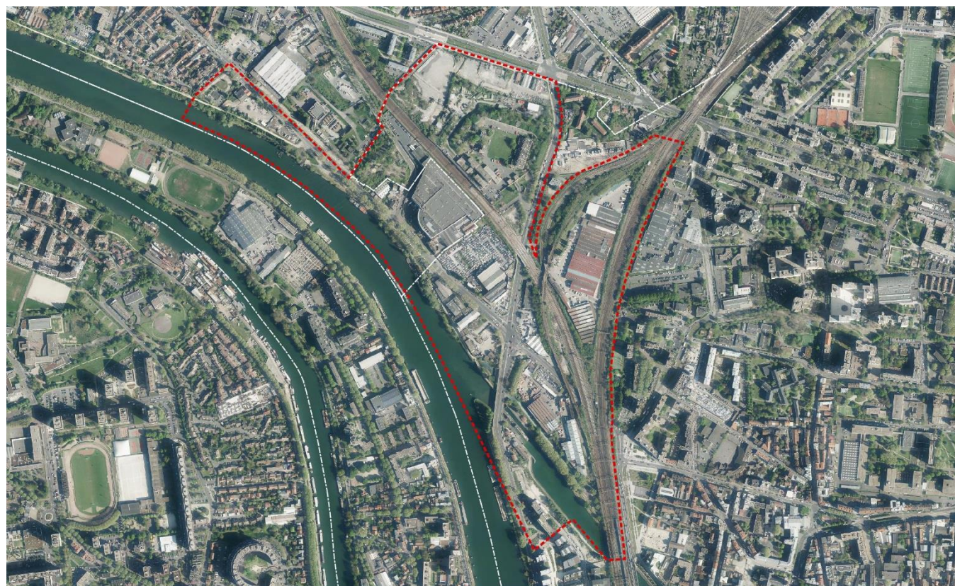
La Briche, vue satellite et périmètre de l'OAP