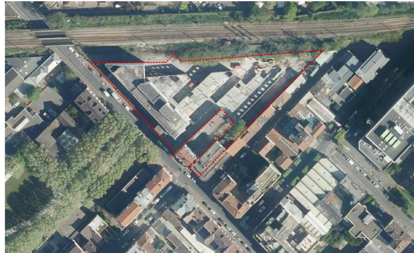
Ex-Valéo, vue satellite et périmètre de l'OAP